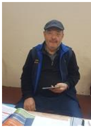
MARONESE DANIELE LINO GIUDICE ONDULATI/PSITTACIDI